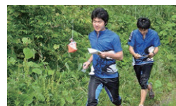
オリエンテーリング部 ■

70年以上の伝統と実績を誇るクラブです。自主性を優先し、個々を尊重する指導法に定評あり。