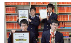
ビジネス研究部・図書同好会 ■

会報制作のための企画・取材・撮影や、画像処理・編集作業、学園祭での展示が活動のメイン。