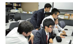
プログラミング部 ■

火・木・土が基本的な活動日。オリジナルのゲーム作成を目指し、プログラミングを研究中。