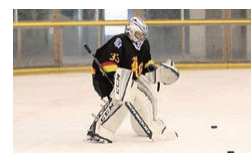
スケート部 (アイスホッケー)

中学時代に運動部に入っていない部員も。ラグビーの厳しさと楽しさを体得しています。