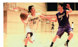
バスケットボール部 ■

県大会の優勝回数は、県内最多。夏の全国大会出場を目標に、日々熱心に活動しています。